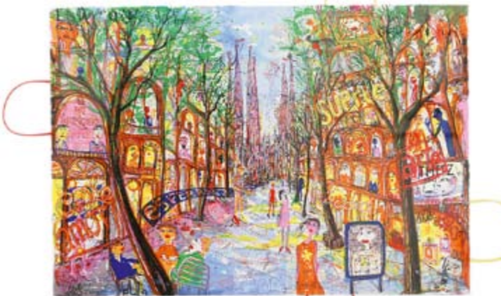
Barcelona Sueño de Gaudi, 2010, Übermalter Künstlersiebdruck auf Hahnemühle Büttenpapier und Tüten, 53 x 78 cm, Aufl. 40 Ex. (teilweise sehr unterschiedliche Übermalungen)